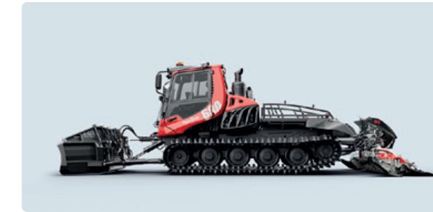
PB 600 Polar PB 800