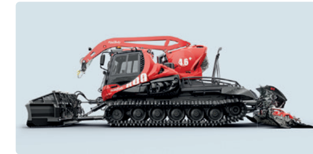
PB 600 Polar PB 800

AB SOFORT WIRD DIE FRÄSE GERN GEWECHSELT Mit dem KFX Schnellwechsellsystem koppelst Du die Fräse in nur 20 Sekunden ab. Und wieder an. Und wieder ab... Ganz bequem, auf Knopfdruck, ohne auszusteigen. Der Vorteil? Weniger Gewicht, mehr Geschwindigkeit beim Schnee schieben. Und eine Zeit- und Spritersparnis von bis zu 20%. Auch für Transportfahrten, fürs Fahren in die Garage usw. ist es praktisch, die Fräse schnell und einfach absetzen zu können. Verliere keine Zeit mehr. Jetzt schnell wechseln – zum KFX Schnellwechsellsystem.