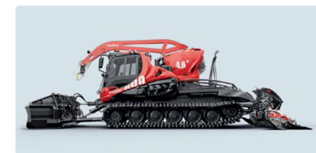
PB 600 Polar PB 800