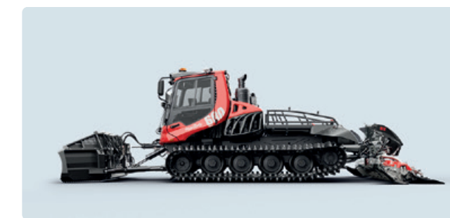
PB 600 Polar PB 800