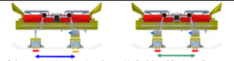
2-fach Spurgerät Vario Track Designer "Competition" + "Classic" für PistenBully 400/600