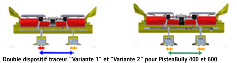
Double dispositif traceur "Variante 1" et "Variante 2" pour PistenBully 400 et 600